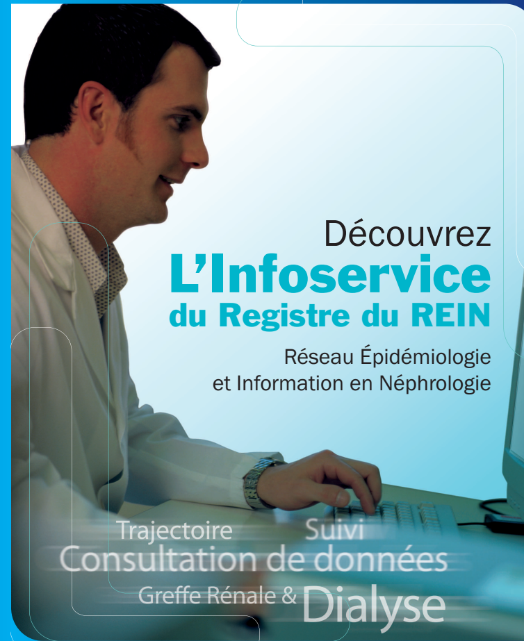
Création : un coin de paradis | www.ucp.fr