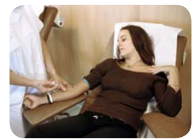
5. Le donneur passe de nouveau un entretien médical et refait une prise de sang