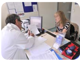
1. La demande d'inscription du donneur

Puis, lorsqu'une compatibilité est finalement avérée entre un donneur et un malade, le donneur inscrit est appelé : cela signifie qu'un malade ayant besoin d'une greffe de moelle osseuse est compatible avec son système HLA. La probabilité d'être compatible entre deux individus pris au hasard est très rare, d'où la nécessité de faire grandir le registre français de donneurs.