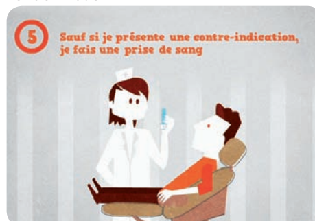
5 - Sauf si je présente une contre-indication, je fais une prise de sang