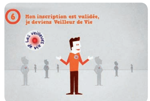
6 - Mon inscription est validée, je deviens Veilleur de Vie

Devenir donneur est un engagement fort, qui nécessite de s'informer et de bien réfléchir avant la démarche. Il suppose que chaque personne soit suffisamment informée sur les implications du don, avant d'accepter de donner un peu d'elle-même pour, un jour, peut-être, sauver une vie. Le site Internet www.dondemoelleosseuse.fr donne toutes les précisions utiles sur ce don et lutte contre les idées fausses. Il permet également de se préinscrire facilement sur le registre France Greffe de Moelle de l'Agence de la biomédecine.