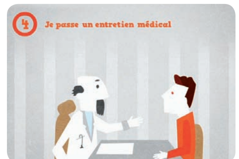
4 - Je passe un entretien médical