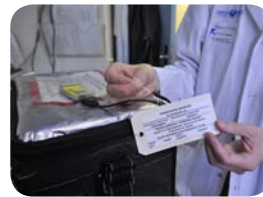
9. La moelle osseuse est ensuite acheminée vers l'hôpital greffeur