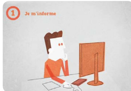
1 - Je m'informe