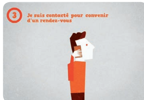
3 - Je suis contacté pour convenir d'un rendez-vous