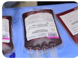
8. La moelle osseuse est acheminée dans un container spécifique vers le laboratoire spécialisé en vue de la greffe