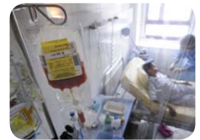
10. Le greffon de moelle osseuse est transfusé par voie veineuse au patient hospitalisé dans un service spécialisé