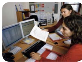
3. La confirmation de l'inscription sur le registre France Greffe de Moelle