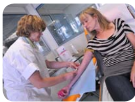
2. Le rendez-vous médical du donneur/la prise de sang