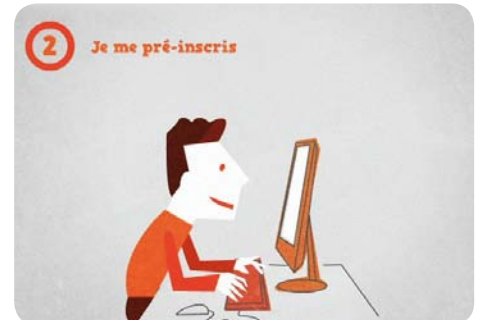
2 - Je me pré-inscris