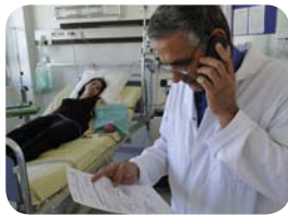
7. ...ou, il peut se faire dans le sang par cytophérèse, en ambulatoire