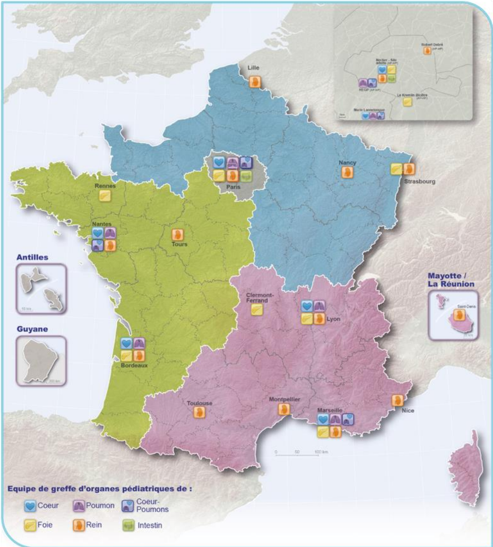
Figure G2. Répartition territoriale des équipes de greffe d'organes pédiatriques